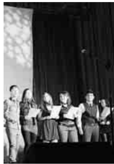
UN MOMENTO DELLA MANIFESTAZIONE