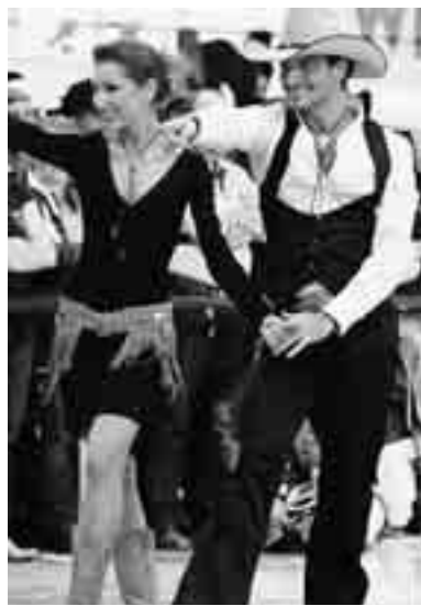
UNA DELLE COPPIE PROTAGONISTE